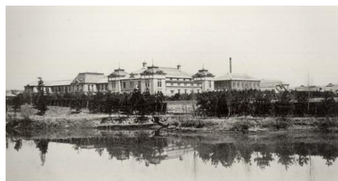
名古屋高等工業学校

名古屋工業大学は、1905年（明治38年）に官立の名古屋高等工業学校として創設され、幾多の有名な人材を中京地域はじめ全国に輩出してきました。ものづくり産業の世界的な集積地である中京地域とともに、工学のほとんどの分野をカバーするわが国屈指の国立工学系単科大学として、これからも成長・発展を続けていきます。